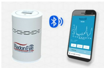
라돈가스 감지기 (라돈아이)