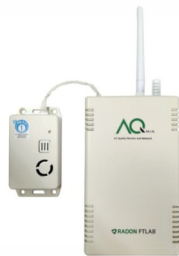
IoT 공기질 모니터링 시스템(에이큐맨)